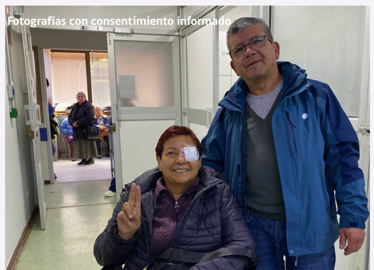
Fotografías con consentimiento informado