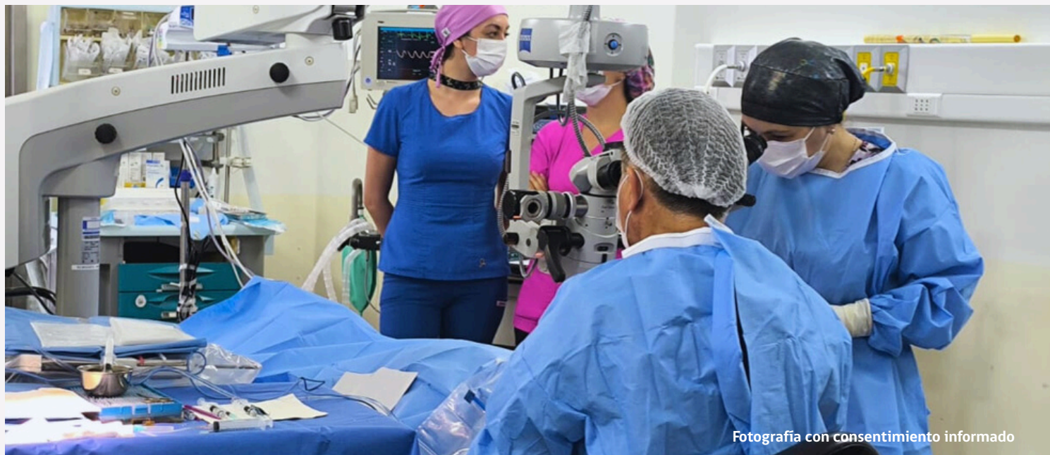
Fotografía con consentimiento informado