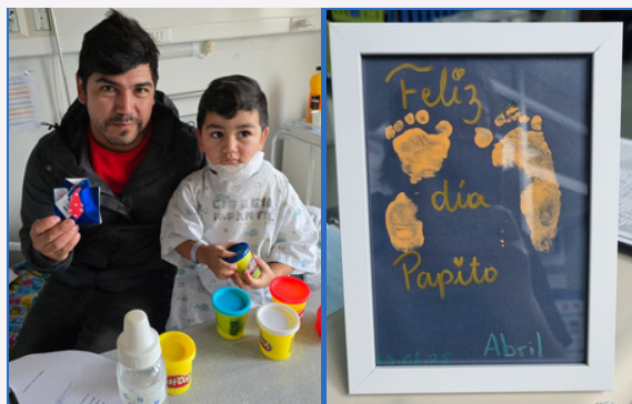
Fotografía con consentimiento informado

En la Unidad de Oncohematología Infantil, niños y niñas han tenido la oportunidad de participar en un colorido taller de fieltro, donde pudieron crear figuras, compartir y disfrutar de una experiencia distinta durante su hospitalización. La actividad se enmarca en las iniciativas de humanización que promueve el establecimiento, con el objetivo de brindar entornos más cálidos y acogedores para sus pacientes.