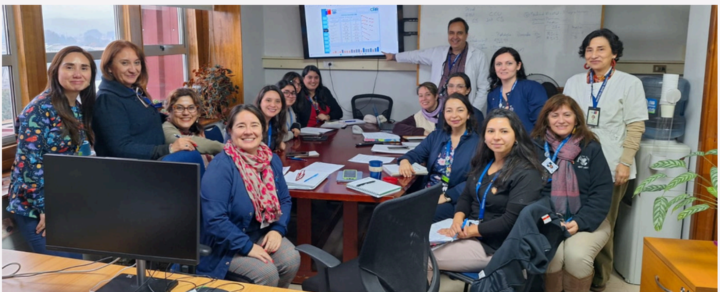
Comisión Financiera Clínica de la estrategia CRR.