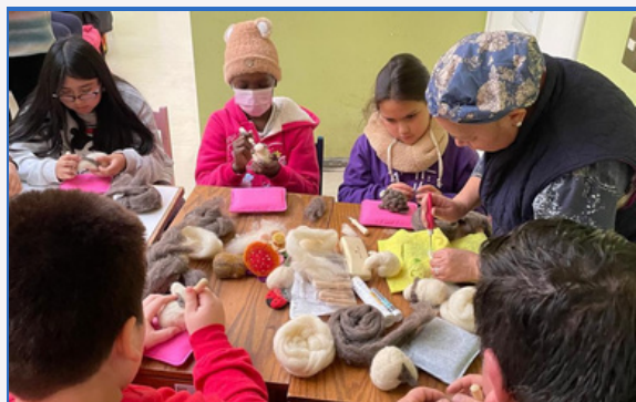
Fotografía con consentimiento informado