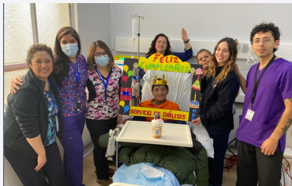
Fotografía con consentimiento informado