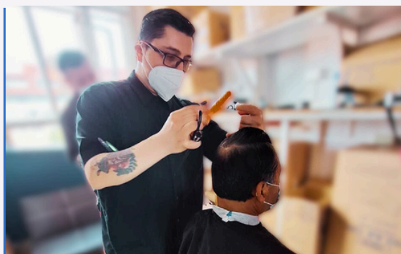
Fotografía con consentimiento informado

Se trata de sesiones realizadas en la Unidad Geriátrica de Agudos (UGA) y Pediatría, orientadas a promover una experiencia hospitalaria más positiva y mejorar el estado anímico de los pacientes, contribuyendo a su recuperación. Esta instancia recreativa también está pensada para integrar a las familias, haciendo más llevadero y humano el proceso de hospitalización.