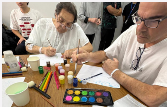
Fotografía con consentimiento informado

Desde mayo el Hospital Base Valdivia celebra el cumpleaños de sus pacientes hospitalizados con la entrega de mini tortas, como parte de su compromiso con una atención más humana. Esta acción, busca entregar un momento de alegría y contención emocional, contribuyendo al bienestar integral de los pacientes.