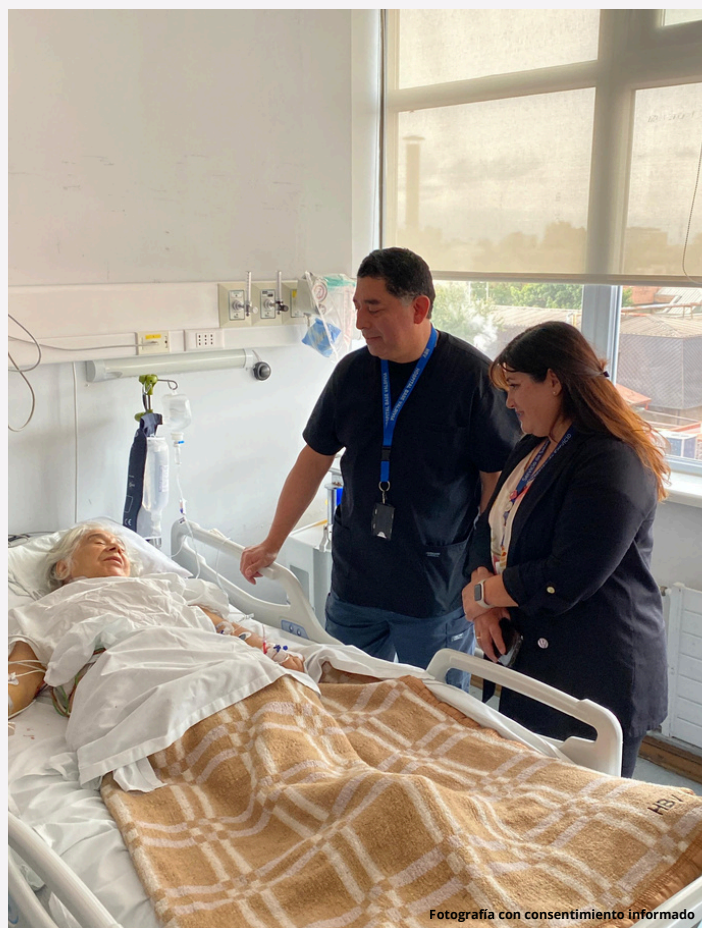
Fotografía con consentimiento informado

Gracias al TAVI, se ofrece una alternativa segura y menos invasiva para pacientes de alto riesgo, marcando un avance relevante en la atención cardiológica del hospital.