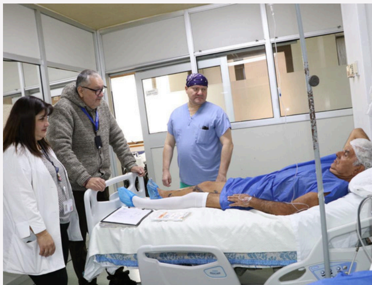
Fotografía con consentimiento informado