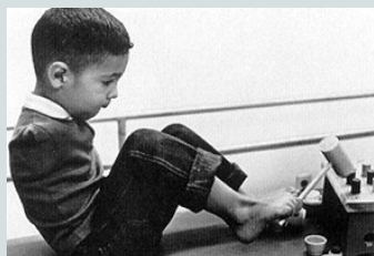
Malformaciones debido al uso de Talidomida durante el embarazo

Tiempo después, y un año antes de que se empezara a comercializar internacionalmente, apareció